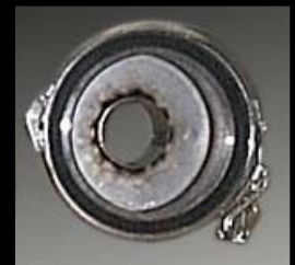
Fig. 2 Indvendig side Udgangsdelen..