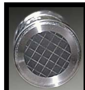
Fig. 1 Filter udgang.